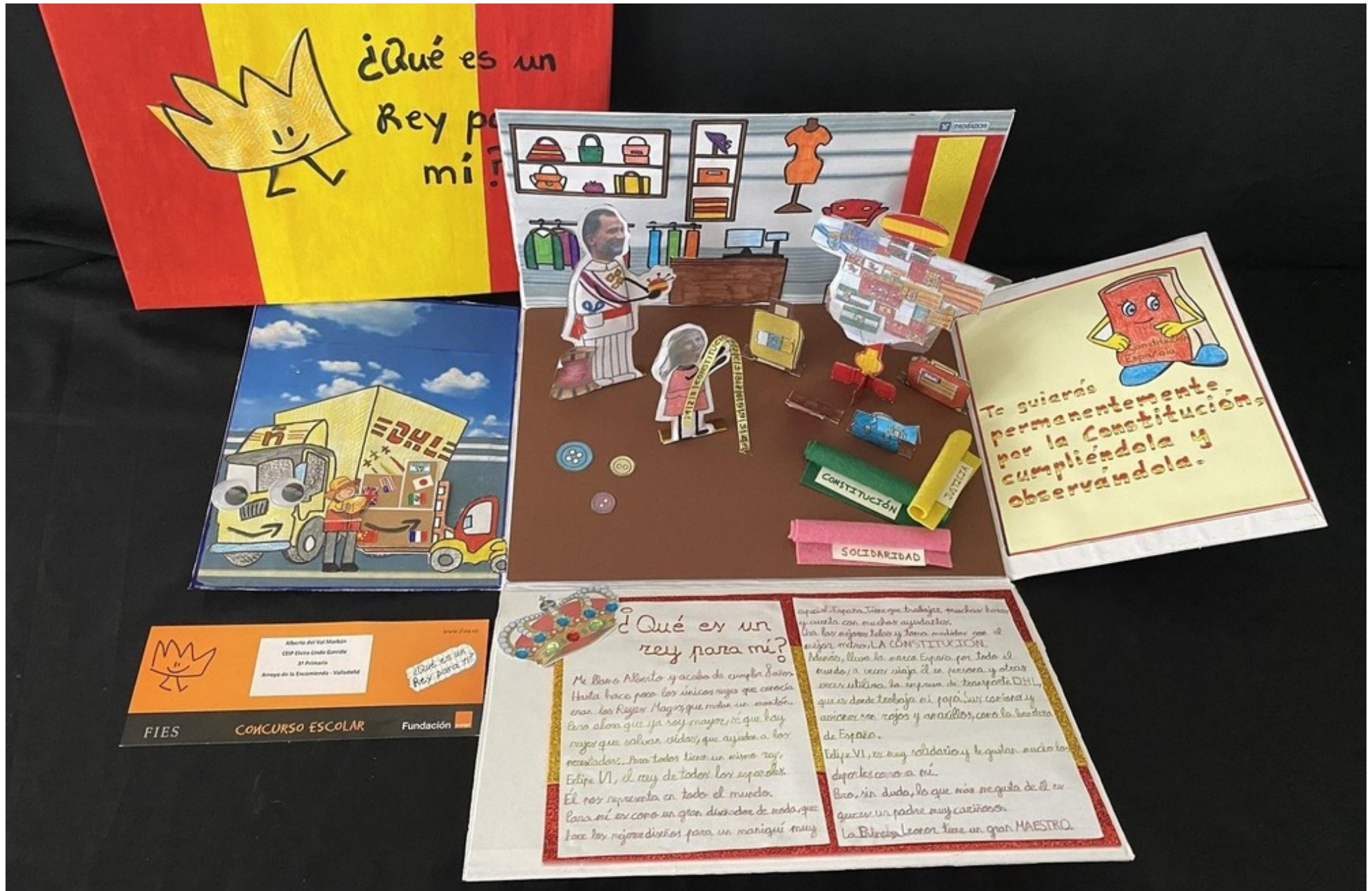
Trabajo presentado por Alberto del Val.

Alberto del Val Marbán CEP Elvira Linda Garrido 3º Primaria Avenida de la Encarnación - Valladolid www.fies.es ¿Qué es un Rey para mí? FIES CONCURSO ESCOLAR Fundación